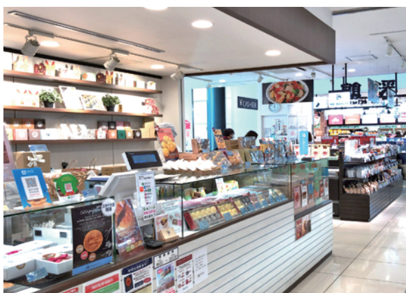
▲1階 お土産専門エリア

1階はお土産を中心とした専門店エリア、2階は飲食ゾーンとし、ご旅行の方はもちろん、地元の方にも楽しめる施設となっています。