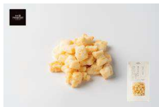
北海道産もち米使用 北のおかき 北海道チーズ