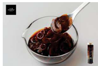
北海道産にんにく使用 ぎゅっとにんにく醤油

北海道産の干しにんにくに、八雲町の老舗・服部醸造の本醸造醤油「八雲」をしみ込ませました。