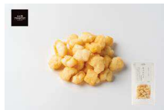
北海道産もち米使用 北のおかき 北海道帆立