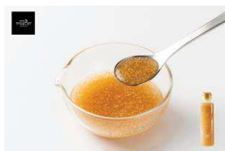
北海道産数の子使用 ぶちっとかずの ノンオイルドレッシング

北海道産数の子を使用したノンオイルドレッシング。甘酸っぱい爽やかな味に仕上げました。