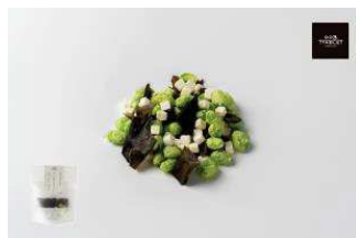
北海道十勝産枝豆使用 おやつ昆布と枝豆チーズ

乾燥させてパリパリにした北海道産の昆布に、乾燥させた十勝産の枝豆とチーズをミックスしました。