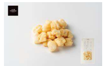
北海道産もち米使用 北のおかき 池田の山わさび