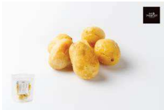
北海道十勝産 野菜のおやつ まるごとじゃがいも