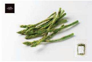
北海道羊蹄山麓産 野菜のおやつ まるごとアスパラ

羊蹄山麓産の採れたてアスパラを、ポイルしてからフリーズドライ製法でサクッと仕上げました。