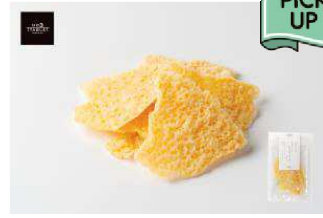
北海道産生乳使用 ニセコでつくった クリスピーチーズ プレーン