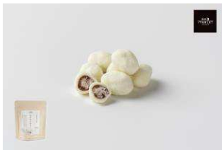
北海道産小豆使用 あずきとみるく