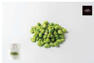
北海道十勝産 野菜のおやつ 枝豆

北海道十勝産の枝豆を、塩味をつけてからフリーズドライ製法でサクサクに仕上げました。