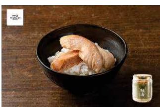
北海道日本海産 寒風やぐら干し 鮭寿(けいじゅ) 荒ほぐし