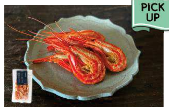
北海道根室産 まるかじり北海しまえび