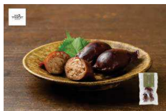
北海道・道南の郷土料理 ちゃんこいいかめし