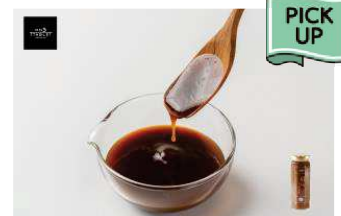
北海道産うに使用 とろ〜りうにソース

八雲町の老舗・服部醸造の醤油ベースに、北海道産うにと奥尻ワインを使用した濃厚ソースです。