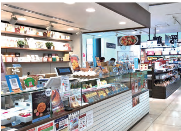
▲1階 お土産専門エリア

1階はお土産を中心とした専門店エリア、2階は飲食ゾーンとし、ご旅行の方はもちろん、地元の方にも楽しめる施設となっています。